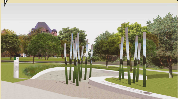
THE MONUMENT FRANCO-ONTARIEN

Entitled "Notre Place", the monument highlights the key role you play, as a Francophone, in Ontario's history and in building a modern, open and inclusive society. It consists of three essential elements: the trail, the forest and the clearing. These elements trace the centuries-long journey of the Francophones who helped build Ontario.